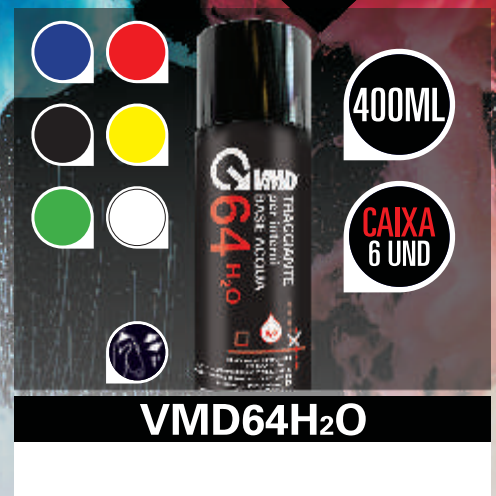
VMD64H 2 O