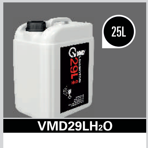
VMD29LH 2 O